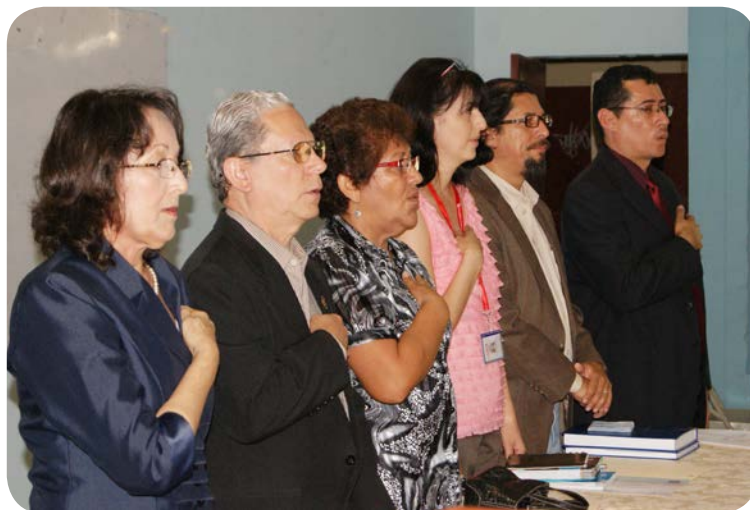
Mesa de honor. Autoridades universitarias participaron en la inauguración oficial de la nueva carrera en Letras.

La actividad se llevó a cabo el pasado viernes 3 de mayo en el auditorium 3 de la Facultad de Ciencias y Humanidades.