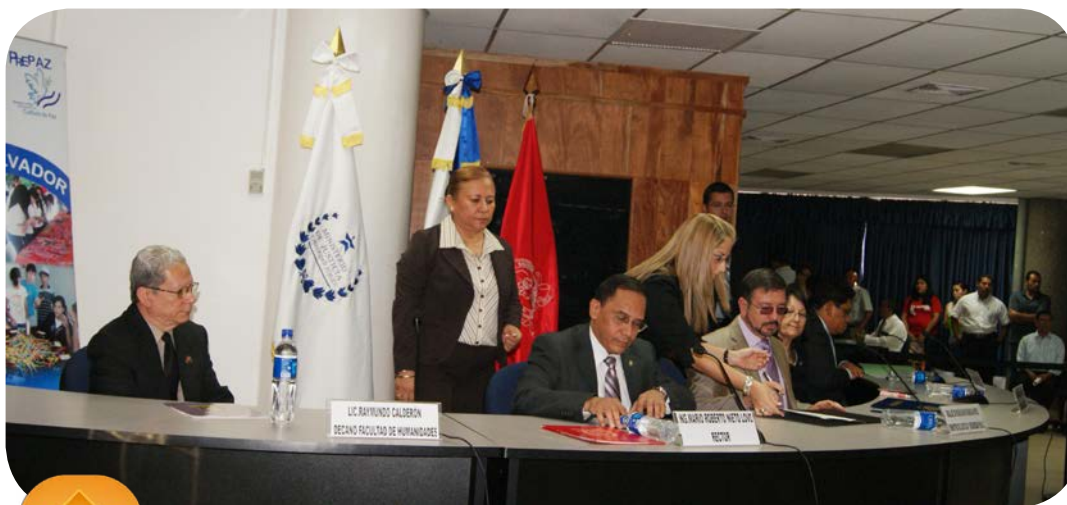
Firma de convenio. El Rector de la UES y el Ministro de Justicia y Seguridad Pública acuerdan crear proyectos sobre prevención de la violencia.

Síguenos en la Web: http://www.humanidades.ues.edu.sv/